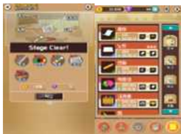
인벤션시티(Invention City) 발명학습 게임 (중·고등학생)