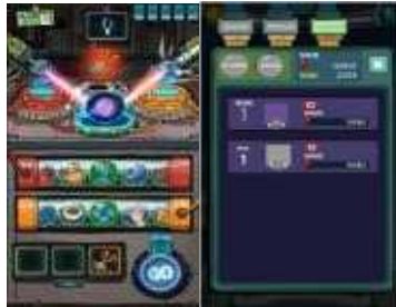
닥터 폴(Dr. Paul) 발명학습 게임 (중·고등학생)