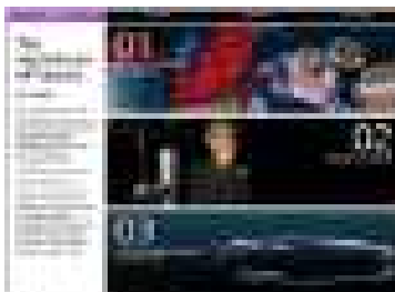
IP 파노라마 모바일(IP Panorama Mobile) 지식재산 활용 사례 학습 (일반인)