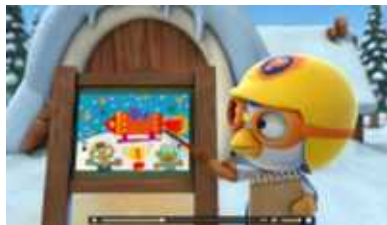
발명왕 뽀로로 발명학습 애니메이션 (유·소년)