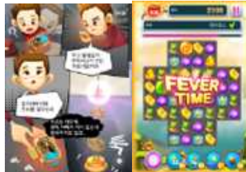
발명탐정 진(Jin) 발명학습 게임 (초등학생)