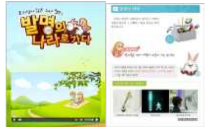
디지털 창의와 발명 발명학습 디지털 텍스트북 (초등학생)