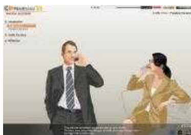
IP 파노라마(IP Panorama) 지식재산 활용전략 학습 (기업인)