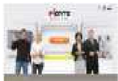
IP 이그나이트(IP Ignite) 국제법적 관점에서 지식재산 학습 (대학(원)생)