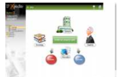
IP 익스피다이트(IP Xpedite) 특허정보 검색·활용 방법 학습 (특허정보활용 전문가)